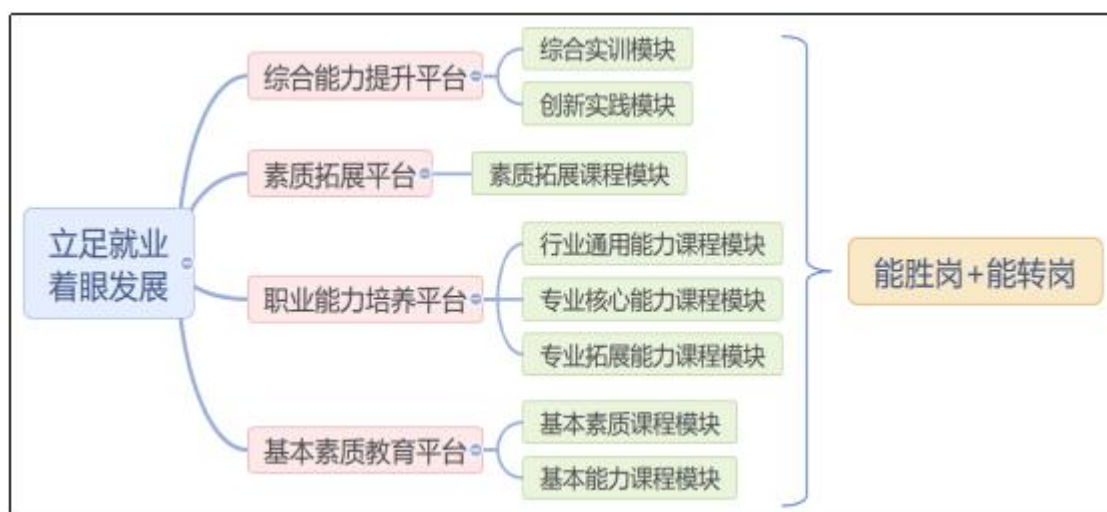
图 4 沅江市职业中专学校专业群能力模块化结构课程体系

沅江市职业中专学校瞄准岗位，构建模块化能力机构课程体系。以突出实践能力和技能培养为核心，按照“从就业岗位往回找技术技能，从技术技能往回找课程体系，从课程体系往回找教学资源，从教学资源往回找教学运行，从教学运行往回找体制机制”的方法与路劲，构建模块化能力结构课程体系。通过校企合作方式开展专业核心课程建设，以产教融合建设为抓手，将行业职业标准引入教学内容，不断丰富“理实一体”和纯实践课程建设，保障技术技能人才培养质量。