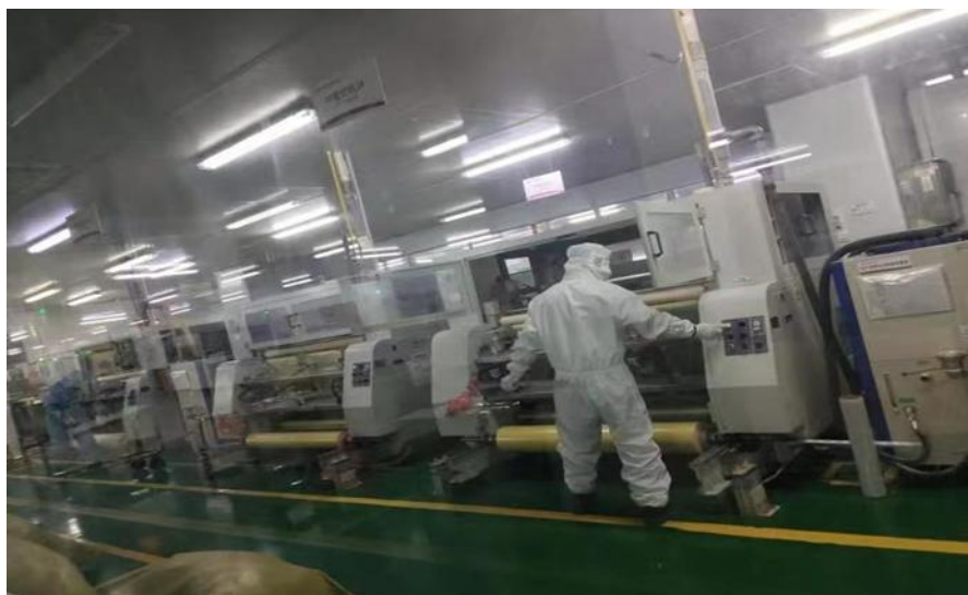
图 6 桃江县职业中专学校将课堂搬到企业，让学生进入角色

度，组织学生到相应的实训基地参加见习、实训实践活动，缩短学生的就业适应期，使学生毕业后就能顶岗，直接为企业带来经济效益。