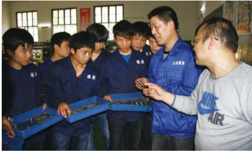
图 12 企业导师对学生实训作品进行点评