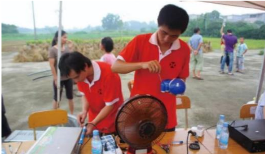
图 16 毕业生服务乡村进行小家电维修