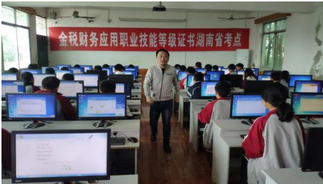
图 5 沅江市职业中专学校举行 1+X 证书考试