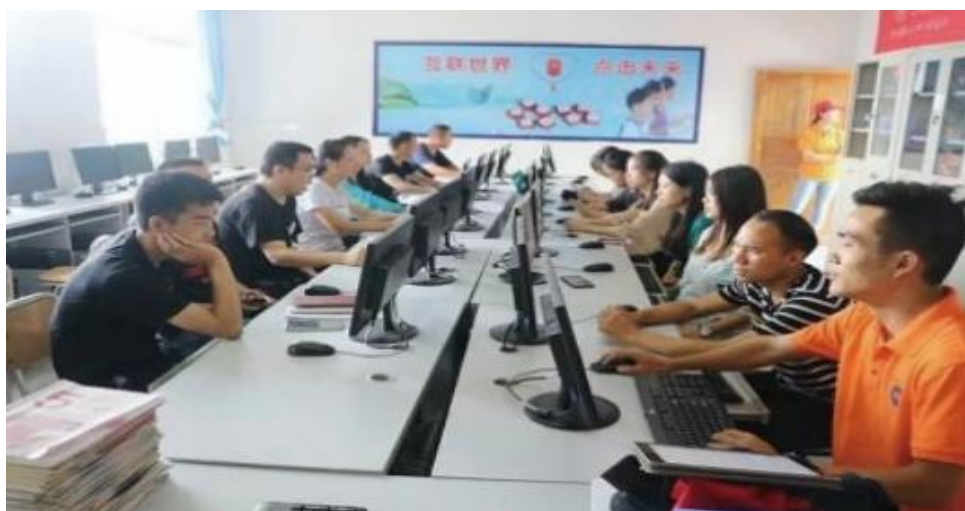
图 15 毕业生服务乡村进行计算机培训

沅江市职业中专学校着力服务乡村乡村振兴，一是组织毕业生服务乡村振兴活动。通过多种渠道和方式，如招聘会，网络宣传，社区活动等，积极组织毕业生参加服务乡村振兴工作。二是提供专业培训和支 持。针对毕业生在农村工作中可能遇到的问题，学校提供专业培训和支 持，包括农业技术，乡村规划，环境保护等方面的知识和技能。同时，学校还邀请经验丰富的专家学者，为毕业生提供指导和支持，帮助他们更好的融入农村工作环境。三是开展乡村社会服务和文化建设。为了推动农村经济发展和社会进步，学校在农村开展了多项社会服务和文化建设活动。例如，组织环保知识讲座，开展农民技能培训等，旨在提高农民的文化素质和生活质量。