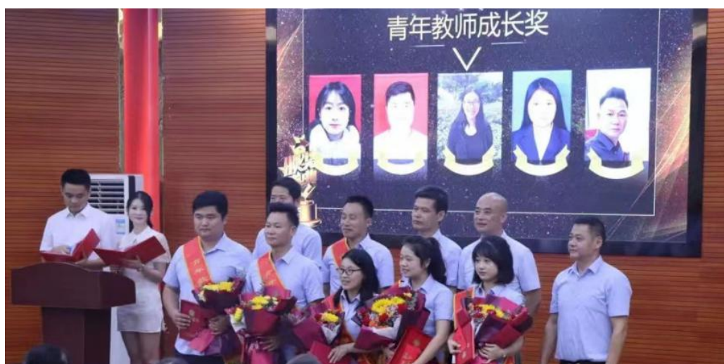
图 10 优秀教师表彰大会

为进一步调动教师的工作积极性和主动性，推进学校规范化、制度化和科学化管理，各校都制定了详细的荣誉奖励制度，按照荣誉等级，给予相应的奖励。