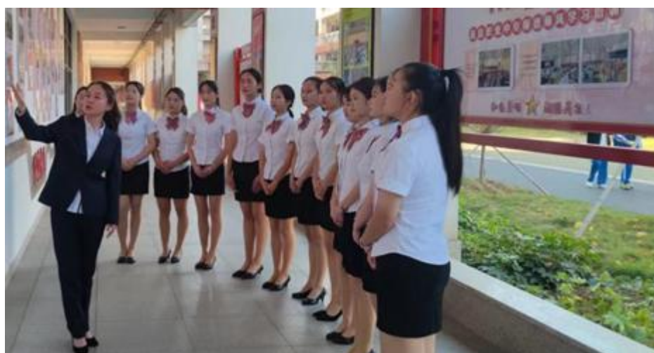
图 22 学校红色讲解团

(6) 与红色单位合作建立实践教学基地，开展现场教学、实地考察等活动，让学生更加深入了解红色文化和革命精神。