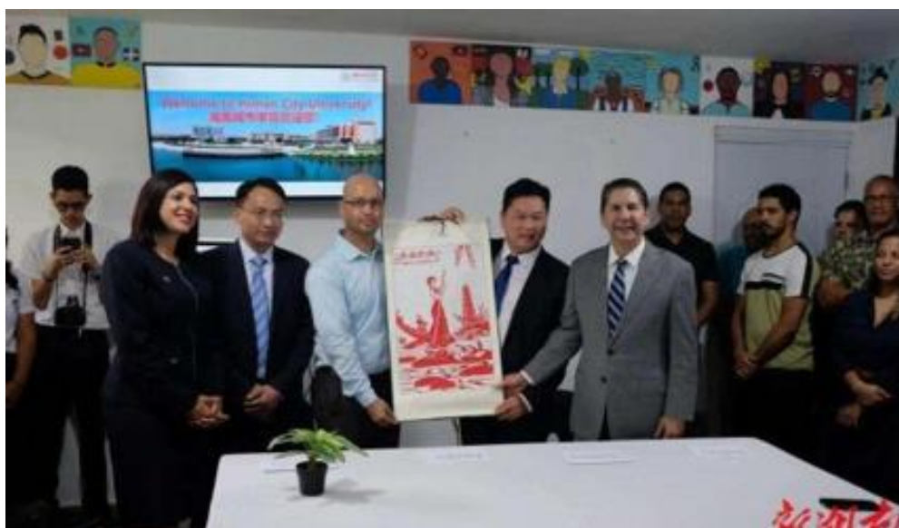
图 27 沅江市委书记向奥尔蒂斯市长赠送职业学校剪纸艺术作品

2022 年 6 月，马拉维驻华大使艾伦·钦泰扎阁下前来沅江考察，出自该校剪纸工作室的两幅作品备受其青睐，成为见证“沅马合作友谊”的文化纽带，更是成为沅江精神文明建设的开放窗口。2023 年 8 月 20 日，沅江市与多米尼加萨尔塞多市在多米尼加共和国萨尔塞多市市政厅举行友好城市关系签署仪式，沅江市委书记向奥尔蒂斯市长赠送出自该校剪纸工作室的代表沅江标志的剪纸艺术作品。