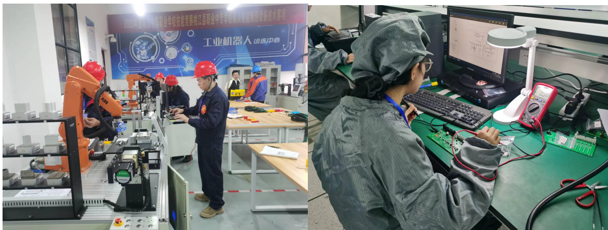
图 11 益阳市学生技能竞赛风采

2023 年湖南黄炎培职业教育奖创业规划大赛，全市中等职业学校获二等奖 1 个，三等奖 6 个，优胜奖 10 个。