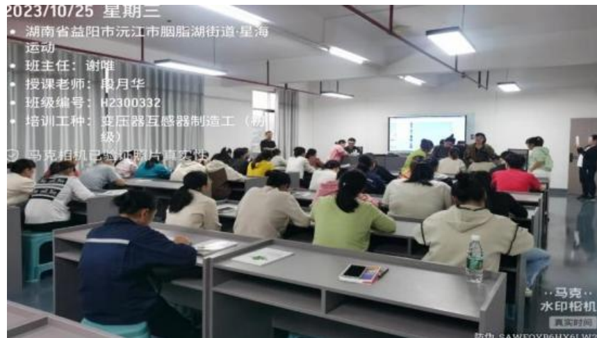
图 13 深入企业开展技能培训