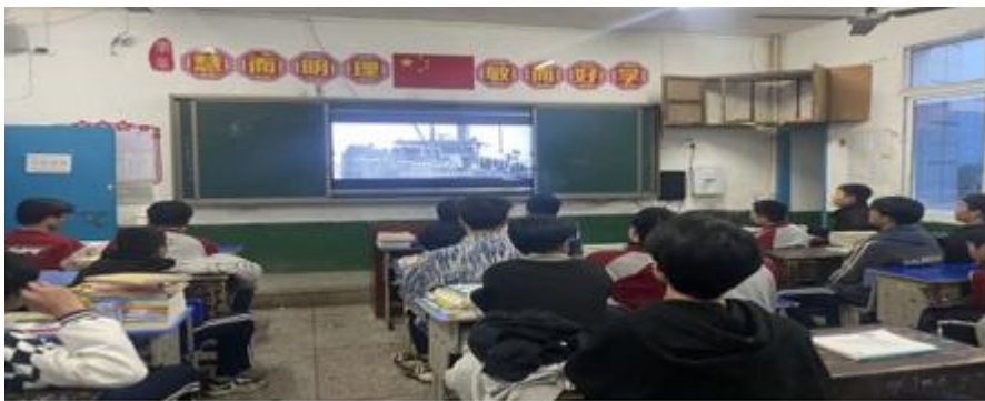
图 26 学校师生观看全国第一步职业教育纪录片《楚怡·百年荣光》

南县职业中等专业学校为凸显职教特点，树立工匠精神，让学生在耳濡目染中受到应有的教育，学校特意在精工楼和巧匠楼下，打造了劳模园和湖湘工匠园。劳模园选取了中国新中国历史上和当代的李四光、王进喜、袁隆平、张桂梅等十位劳模，简介了他们的优秀事迹和劳模精神；湖湘工匠园里陈列着黄伯云、杨长风、唐银波、易冉等十位为祖国和湖南发展作出了杰出贡献科学家和工匠。让学生在实习实训的抬眼间，在校园散步的不经意间，“见贤思齐，见不贤而自省也。”感受劳模精神和工匠精神，为祖国骄傲，为湖南骄傲。