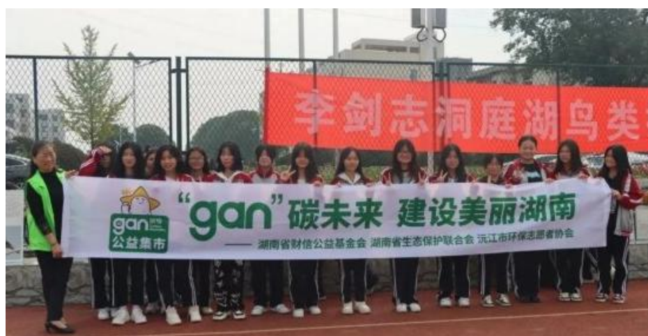
图 19 学校志愿者进社区进行环保宣传活动