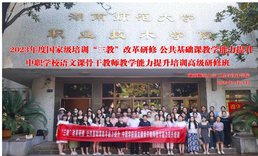
图 8 益阳市第一职业中专学校骨干教师培训

益阳市第一职业中专学校选派专业骨干教师外出学习，为富有潜力的教师掌握前沿教育理念、拓宽专业知识层面、提高学术研究水平创造良好的条件。2022 年国家级培训 10 人次，省级培训 15 人次，市级培训 28 人次，区级培训的人次更多。