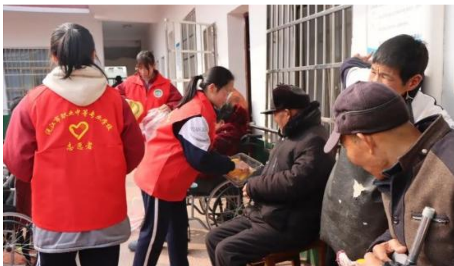
图 18 学校志愿者敬老院志愿服务

同时，积极支持社区建设，加强与沅江市各社区的联系，开展各种社区服务活动、志愿者服务、环保知识进社区、文化活动等方式，加强社区居民之间的联系和互动，从而促进社区的社会发展。