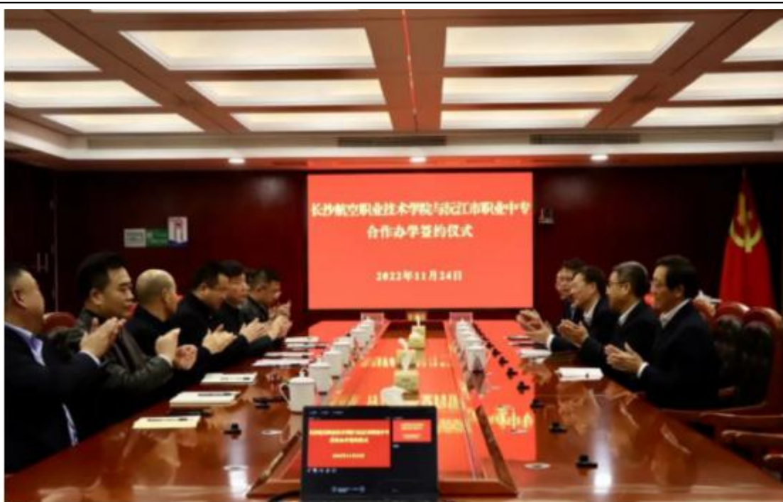
图 3 沅江市职业中专学校中高职合作办学签约仪式

这两个高职衔接班的开办，为学生的深造提供了新机会，为该校毕业生的高平台、高质量就业提供了更有力的保障！