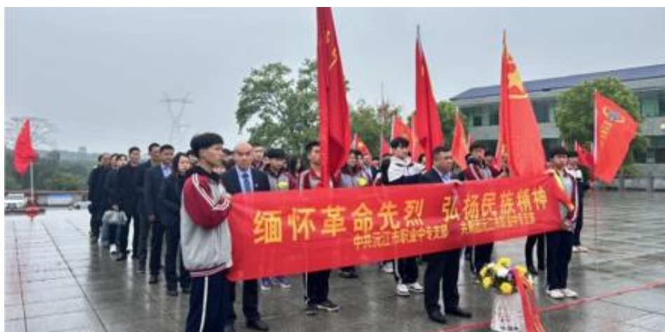
图 23 清明祭扫活动