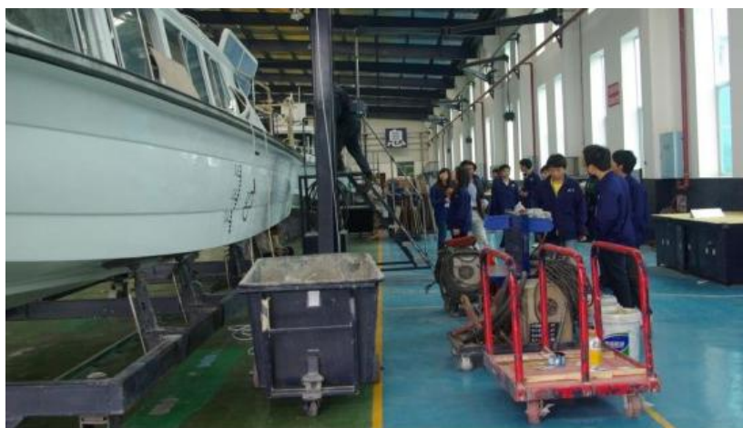
图 14 职业学校为本地企业输送人才

沅江市职业中专学校紧跟市委市政府步伐，结合学校自身办学特色，以及沅江地区区域经济特点，按照“对接产业，优化结构，协调发展，强化特色”的专业建设理念。目前，学校已开设九个专业，其中省级重点专业三个，市级重点专业两个，重点打造两个湖南省特色专业群：机械技工技术专业群服务沅江机械加工制造、船舶特色品牌发展；现代农业技术专业群助力打造具有沅江水乡特色的湖湘品牌，同时对接沅江湿地旅游这一新兴产业。