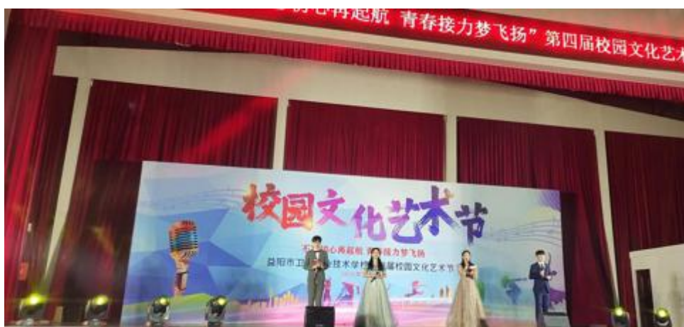
图 25 文化艺术节表演活动

(6) 积极参与省厅组织的弘扬传统文化相关的各类竞赛，且所送审作品皆获得了不同等级的奖励。