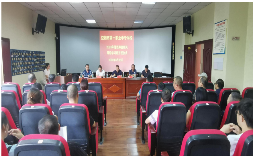
图 9 师德专题培训

为进一步调动教师的工作积极性和主动性，推进学校规范化、制度化和科学化管理，各校都制定了详细的荣誉奖励制度，按照荣誉等级，给予相应的奖励。