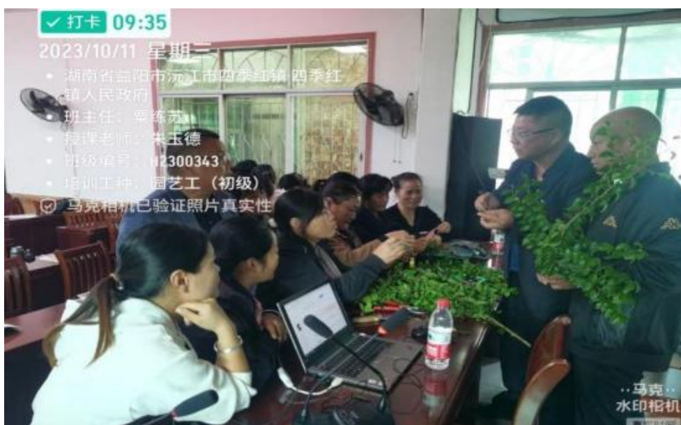
图 17 指导村民农业技术