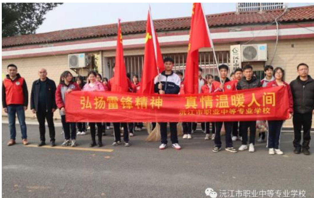
图 1 沅江市职业中专学校以德育人开展志愿服务活动

沅江市职业中专学校针对学生正处于未成年人向成年人转轨期，且整体素质相对欠佳的实际情况，学校坚持以社会主义核心价值观教育为主线，注重学生的养成教育，促进学生的全面发展；坚持推进“三全育人”和“五育并举”，以“立德树人、崇德尚能”为主题，创新开展“大思政工程”建设和“德融课堂”行动等活动，助力营造“书香气、花园式、人文化、精品型”的育人环境，引领学生向上向善，培育学生良好习惯，提升学生职业素养。