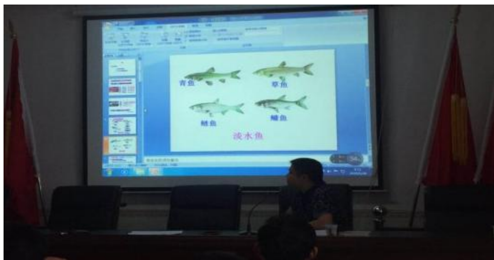
图 20 服务当地产业进行技能培训

沅江市职业中专学校为当地提供针对性的人才培养，为地方创新创业提供人才和技术上的支持，推动地方经济的升级和转型。以灵活的教育模式和与实际工作紧密结合的特点，为地方区域特色的发展作出了重要贡献。