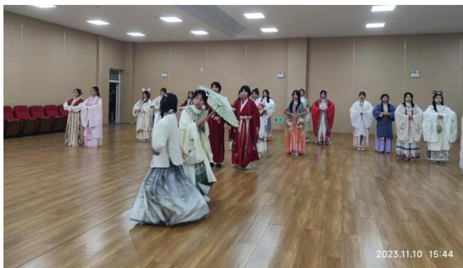
图 2 南县职业中等专业学校学生社团活动

南县职业中等专业学校创新学生管理机制，施行“德育学分制”，提高德育评价的针对性和可操作性，有效引导和规范在校学生思想和行为。学校重视校园文化建设，组建 30 多个学生社团，开展文明风采等德育实践活动。学校倡导“幸福南职，魅力南职”的理念，提出以学会做人为核心，营造幸福校园文化环境。