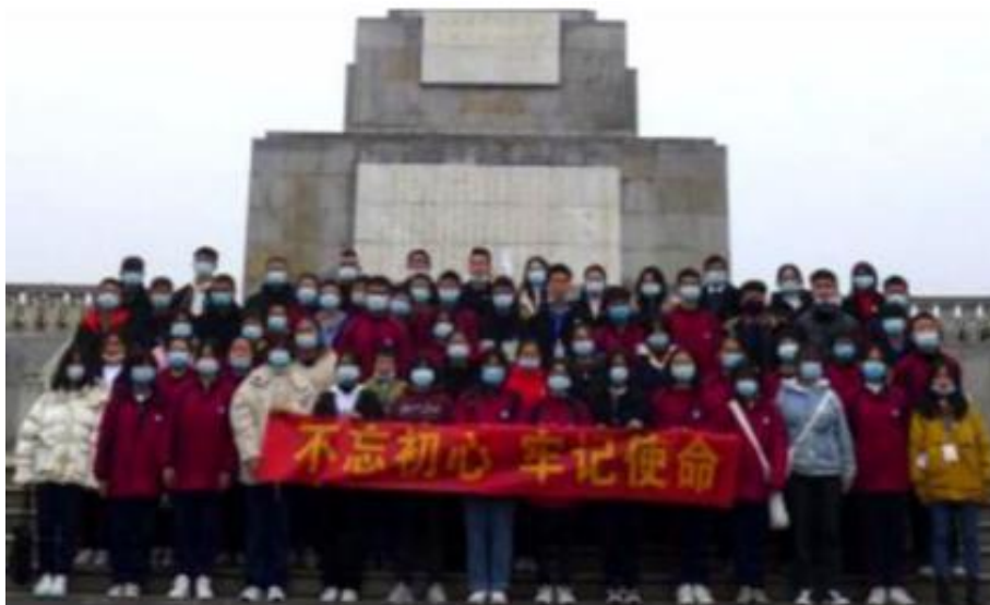
图 24 学校参观红色教育基地