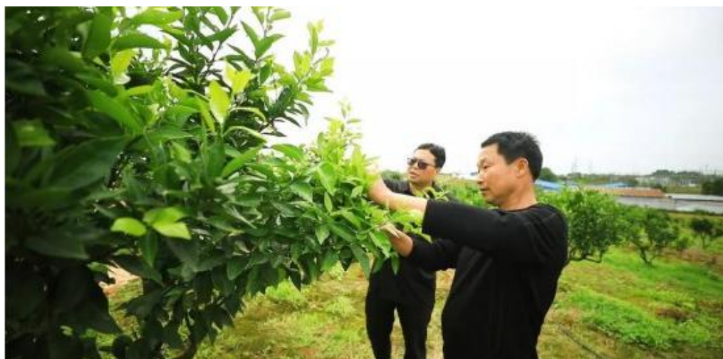
图 21 指导本地农民柑橘技术